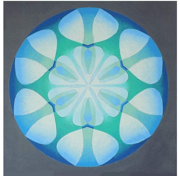
Lune-Poissons. Réalisé par Marceline à partir du dessin de mouvement N° 74 d'Héliorythmie solaire créé par Geneviève Marty-Libert en 1991 (ADAGP 2024)