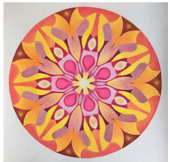
Lune / Saturne. Réalisé par Roseline à partir des dessins des mouvements N° 148 et 337 d'Héliorythmie solaire créés par Geneviève Marty-Libert en 1991 (ADAGP 2024)