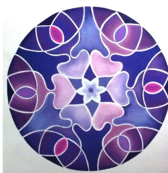
Soleil-Scorpions. Réalisé par Roseline à partir du dessin de mouvement N° 329 d'Héliorythmie solaire créé par Geneviève Marty-Libert en 1991 (ADAGP 2024)