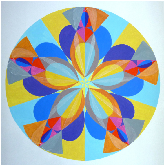
Soleil / Lune. Réalisé par Dominique à partir des dessins des mouvements N° 256 et 320 d'Héliorythmie solaire créés par Geneviève Marty-Libert en 1991 (ADAGP 2024)