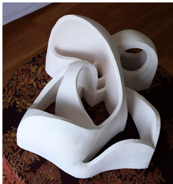
Musique d'argile 1. Créé par Geneviève Marty-Libert en 1991 (ADAGP 2024)

Totalement nouveau, ce modelage musical nous fait approcher concrètement la nature du « Monde éthérique » : Réseau d'énergies formatrices de toutes les créations naturelles : « le moule formant vivant » du monde physique perçu par nos sens physiques habituels.