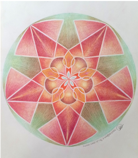
Jupiter-Vierge. Réalisé par Sabine à partir du dessin de mouvement N° 256 d'Héliorythmie solaire créé par Geneviève Marty-Libert en 1991 (ADAGP 2024)