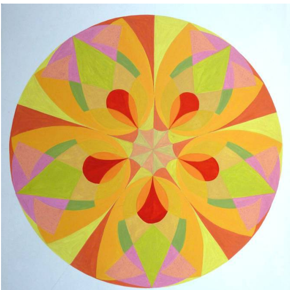
Soleil / Jupiter. Réalisé par Dominique à partir des dessins des mouvements N° 256 et 99 d'Héliorythmie solaire créés par Geneviève Marty-Libert en 1991 (ADAGP 2024)

Ces Mandalas de naissance peuvent être ensuite associés pour donner naissance en images colorées à l'atmosphère de la collaboration entre deux énergies planétaires. Par exemple : mariage du Soleil natal en Vierge avec Jupiter natal en Bélier.