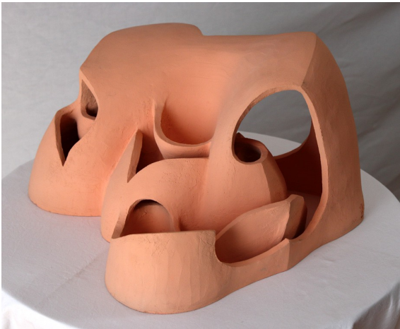
Danse d'argile 1. Créé par Geneviève Marty-Libert en 1991 (ADAGP 2024)

Soixante huit images de ces Modelages musicaux figurent sur mon site.