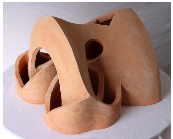
Cascade secrète 1. Créé par Geneviève Marty-Libert en 1991 (ADAGP 2024)