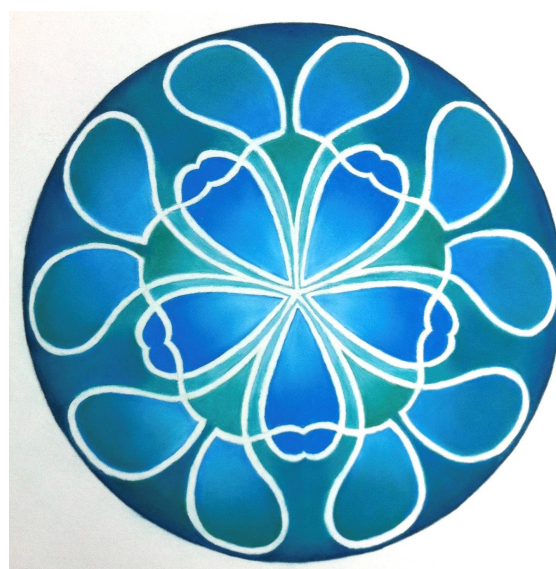
Mars-Poissons. Réalisé par Roseline à partir du dessin de mouvement N° 78 d'Héliorythmie solaire créé par Geneviève Marty-Libert en 1991 (ADAGP 2024)