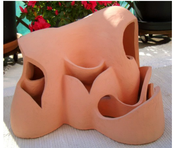
Danse d'argile 2. Créé par Geneviève Marty-Libert en 1991 (ADAGP 2024)