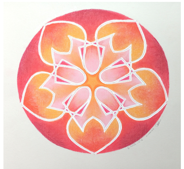
Venus-Lion Version terrestre. Réalisé par Sabine à partir du dessin de mouvement N° 214 d'Héliorythmie solaire créé par Geneviève Marty-Libert en 1991 (ADAGP 2024)