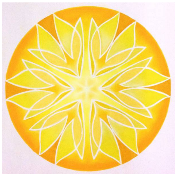
Lune-Gémeaux. Réalisé par Roseline à partir du dessin de mouvement N° 148 d'Héliorythmie solaire créé par Geneviève Marty-Libert en 1991 (ADAGP 2024)

Les jeux avec ces dessins d'Héliorythmie sont inépuisables et nous ouvrent de nombreuses autres expressions possibles.