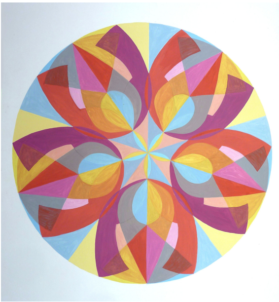
Soleil / Jupiter. Réalisé par Dominique à partir des dessins des mouvements N° 256 et 99 d'Héliorythmie solaire créés par Geneviève Marty-Libert en 1991 (ADAGP 2024)