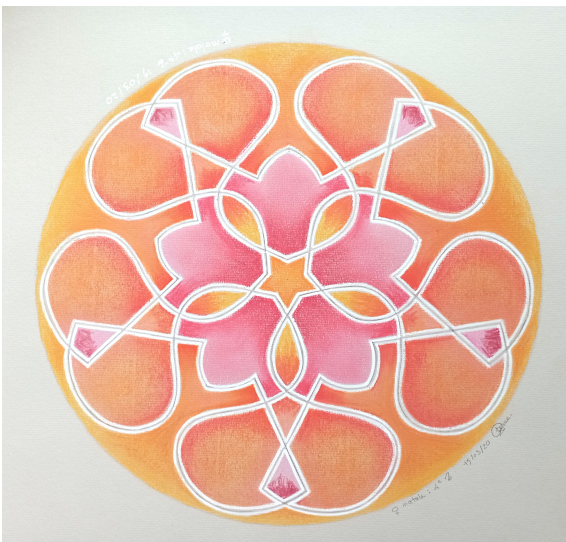
Venus-Lion Version céleste. Réalisé par Sabine à partir du dessin de mouvement N° 214 d'Héliorythmie solaire créé par Geneviève Marty-Libert en 1991 (ADAGP 2024)