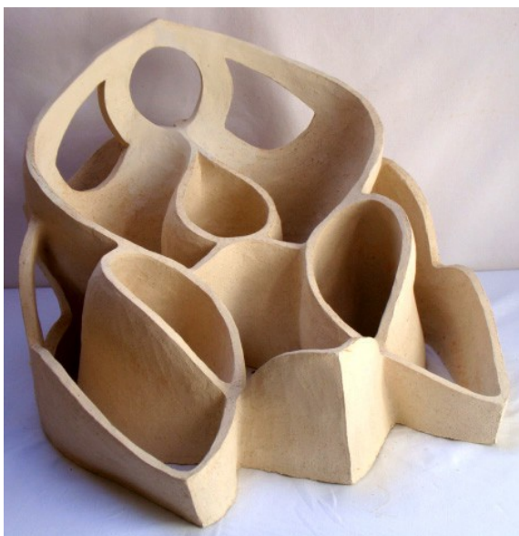
Epiderme créateur 2. Créé par Geneviève Marty-Libert en 1991 (ADAGP 2024)

Mes étudiants de formation en « Pédagogie artistique pluridisciplinaire ( durée de 4ans), ont bénéficié sur une durée de 20 ans du cours préparatoire : « Initiation au modelage musical » où sont expérimentés les principes de base de ce nouveau concept de modelage.